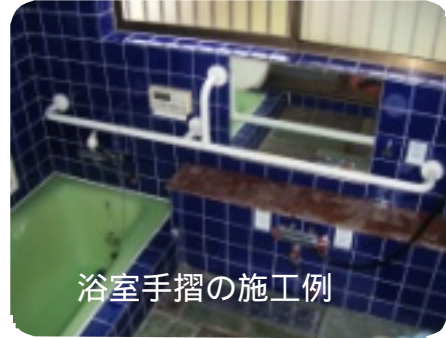
浴室手摺の施工例