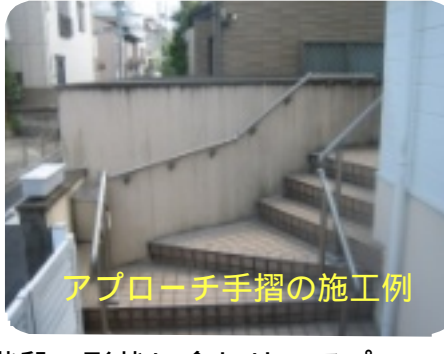
アプローチ手摺の施工例