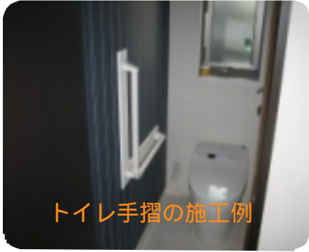
トイレ手摺の施工例

株式会社 ピュアホームズ 〒333-0866 埼玉県川口市芝1-14-3 Tel 048-267-2111 Fax 048-267-2333 http://www.pure-homes.com