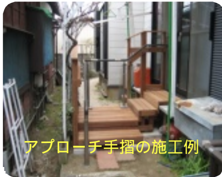
アプローチ手摺の施工例