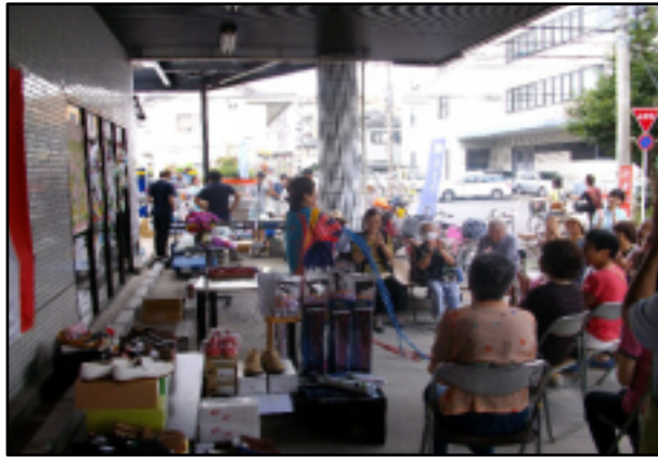
南京玉すだれの実演