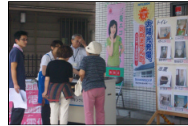
IHクッキングコーナー