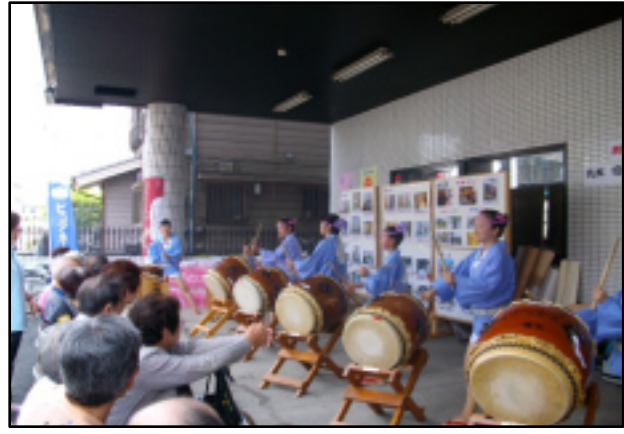
南龍太鼓の皆様による演奏

今回は、当社の各事業部がそれぞれ主催し、IHクッキングコーナー・CS(工事事業)は手作りコーナー・丸太切りタイムトライアル、福祉