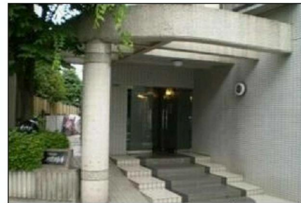
(マンション・エントランス)